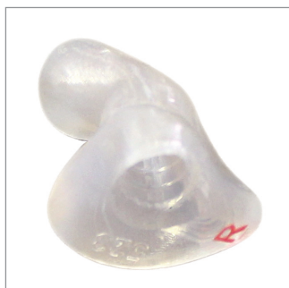
Optional erhältlich: Silikon-Ohrstöpsel nach persönlichem Ohrabdruck (Otoplastik)